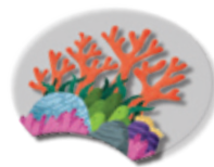
1 διαφάνεια Φυκιών