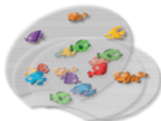
5 διαφάνειες Ψαριών