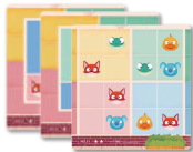
Game card x35